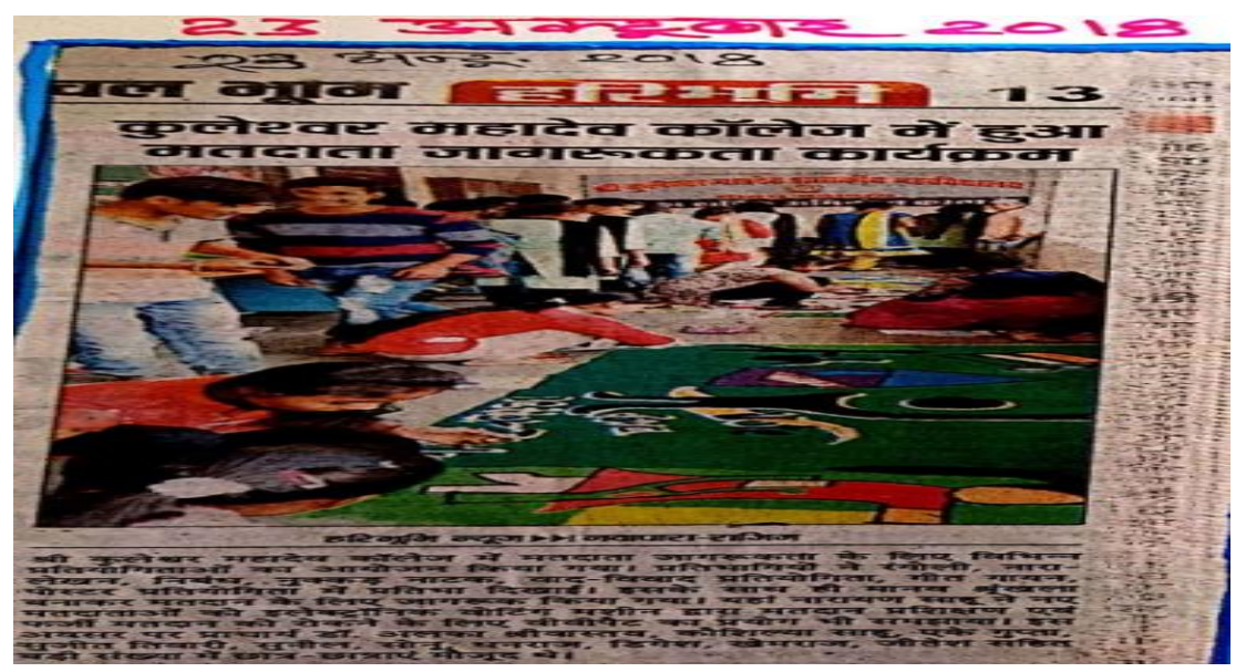
Press Report: haribhumi; dated-23 October 2018