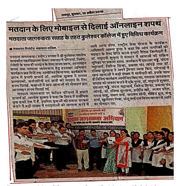
Press Report: Navbharat; dated-10 April 2019