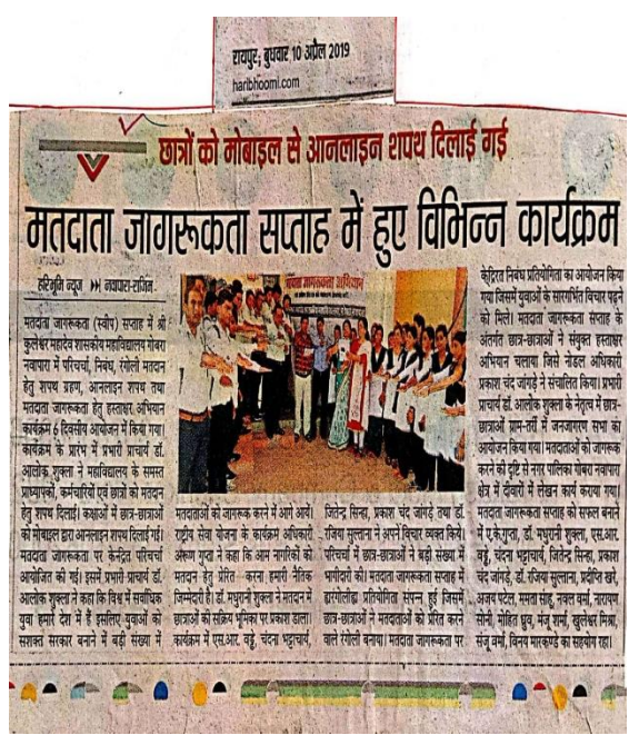
Press Report: Haribhumi; dated-10 April 19